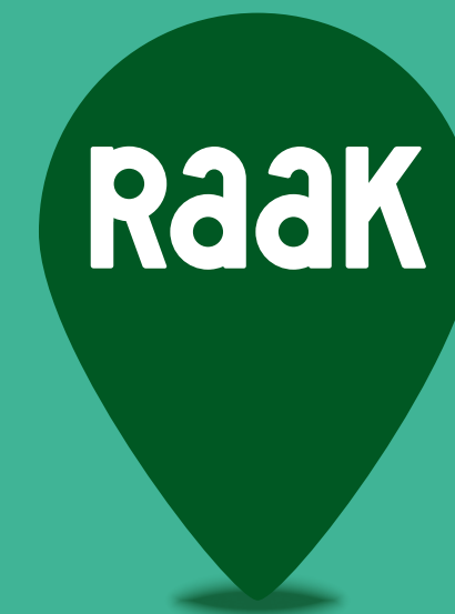
RAAK logo met naam lokale groep